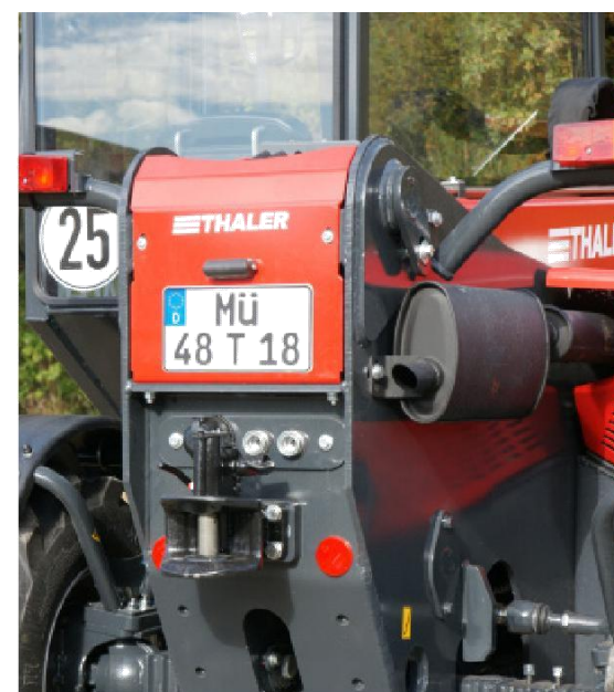
Автоматичен теглич със скоба