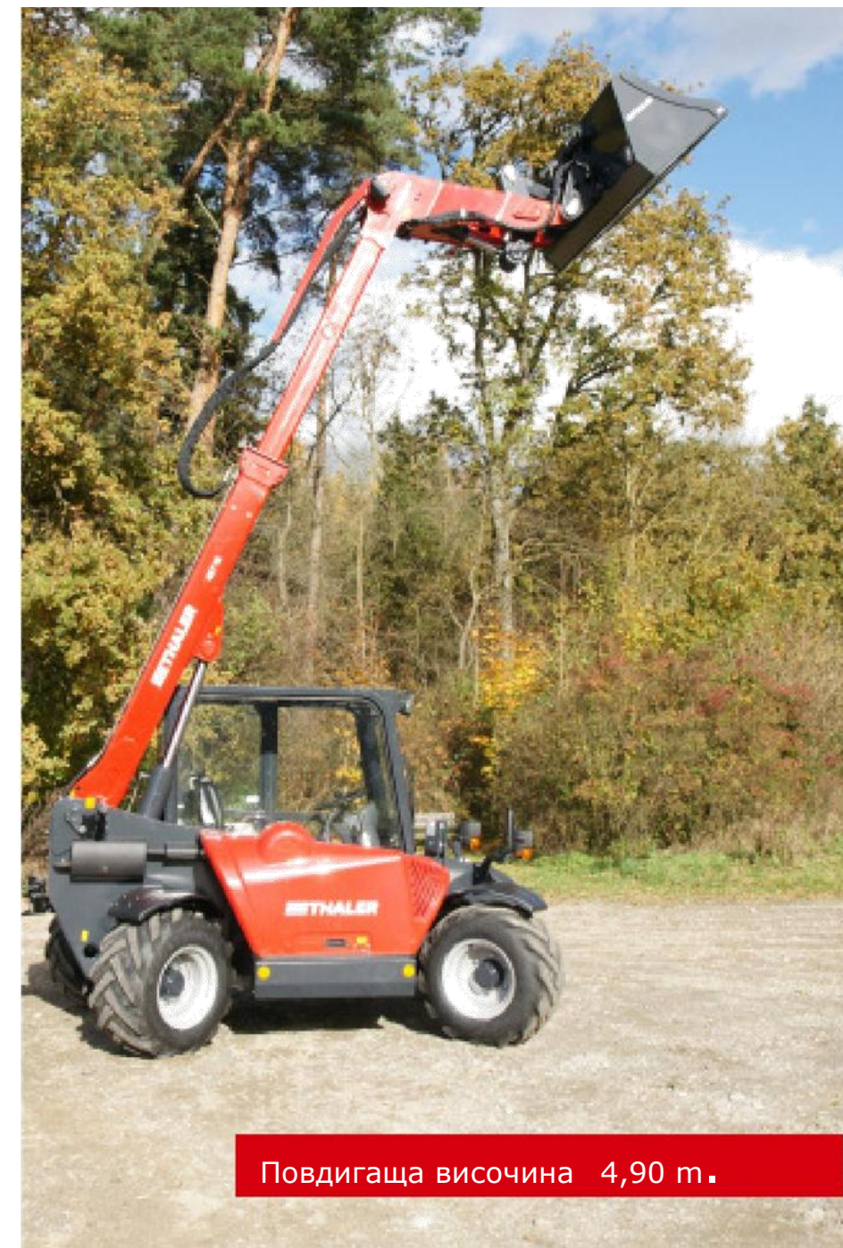
Повдигаща височина 4,90 м.